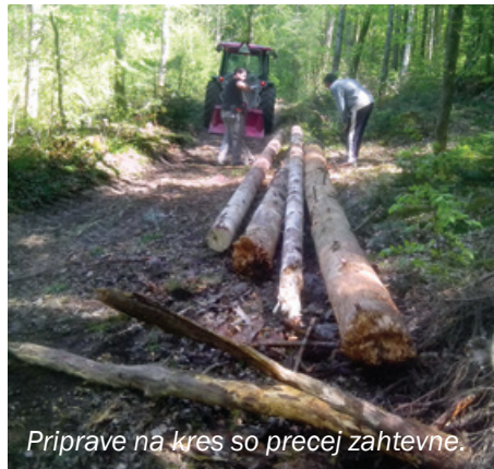
Priprave na kres so precej zahtevne.