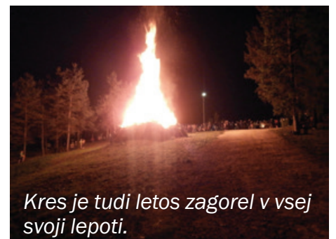
Kres je tudi letos zagorel v vsej svoji lepoti.