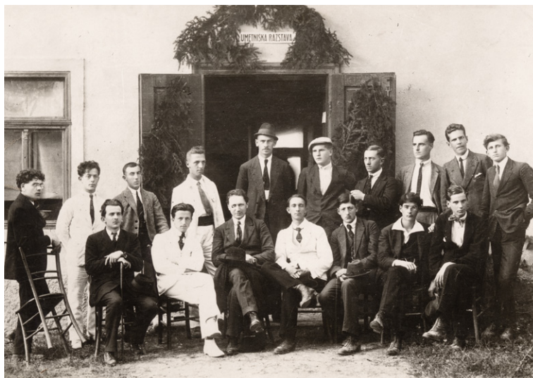
Udeleženci kulturno umetniške manifestacije, kasneje poimenovane novomeška pomlad, na odprtju prve pokrajinske umetniške razstave v Windischerjevem salonu v Kandiji 26. septembra 1920.