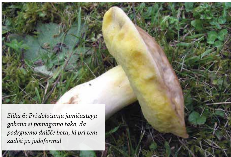
Slika 6: Pri določanju jamičastega gobana si pomagamo tako, da podrgnemo dnišče beta, ki pri tem zadiši po jodoformu!