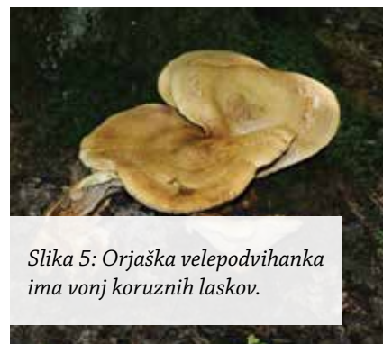
Slika 5: Orjaška velepodvihanka ima vonj koruznih laskov.