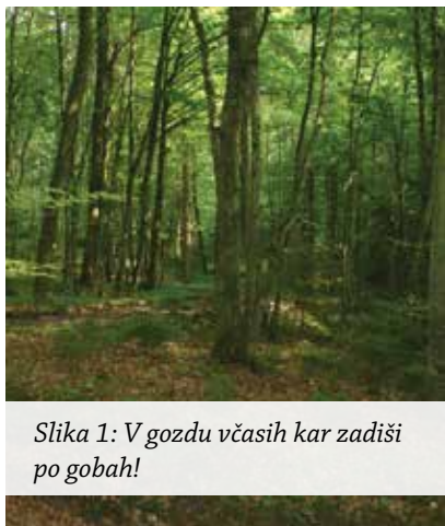
Slika 1: V gozdu včasih kar zadiši po gobah!

Med ljudmi pogosto slišimo, da ima nekdo za gobe »dober nos«. Seveda velja ta oznaka večinoma v prenesenem pomenu. Tako označimo nekoga, ki zna »izvohljati« večje količine gob tako, da poišče terene, kjer gobe obilneje rastejo. Vendar jih običajno najde zahvaljujoč dobremu poznavanju povezav med gobami in drevesi, med podlago, lego, terenom, vremenom in še marsičem. Ali pa je le dovolj vztrajen in prehodi zadostno število kilometrov po različnih gozdovih, dokler se mu ne nasmehne sreča. A drži tudi, da igra nos, oziroma vonj, pri gobarjenju tudi dejansko veliko vlogo. S pomočjo vonja lahko namreč pravi poznavalci resnično odkrijejo rastišče določene vrste gob. Da, ko med hojo po gozdu zaznajo značilen vonj, postanejo bolj pozorni in teren temeljiteje pregledajo. Od užitnih gob se zna tako v gozdu zadovoljivo zaznati vonj po poletnih gobanih, smrčkih, majniških lepoglavkah, vijoličasti kolesnici, navadni mokratici, janeževi livki in še kakšni gobi.