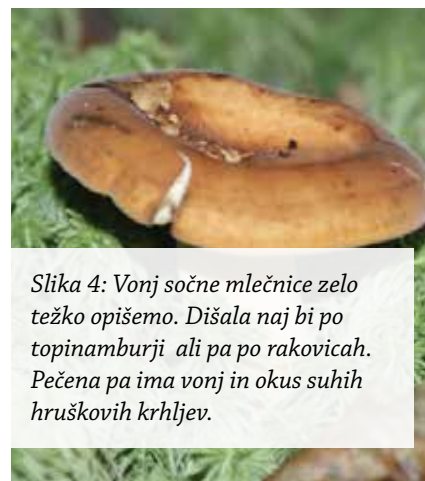
Slika 4: Vonj sočne mlečnice zelo težko opišemo. Dišala naj bi po topinamburji ali pa po rakovicah. Pečena pa ima vonj in okus suhih hruškovih krhljev.

Gobe dišijo tudi po zeliščih, kot je laški krompir ali topinambur. Ena takih je sočna mlečnica. Vonj rumenjačne golobice spominja na jeruzalemske artičoke. Po laškem senu ali sabljasti