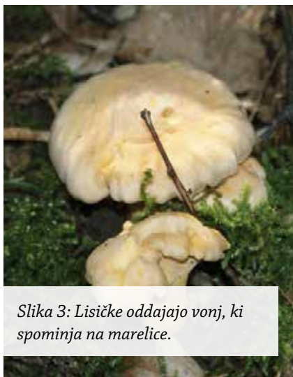
Slika 3: Lisičke oddajajo vonj, ki spominja na marelice.

Vonj pa igra pomembno vlogo tudi pri še eni dejavnosti gobarjev – pri determinaciji oziroma določanju različnih gobjih vrst. Brez večjih težav lahko namreč gobam pripišemo preko sto različnih vonjav. Ti vonji nam pri determinaciji pomagajo, zanimivo pa je to, da lahko nekatere gobe določimo le na podlagi značilnega vonja, ki ga oddajajo.