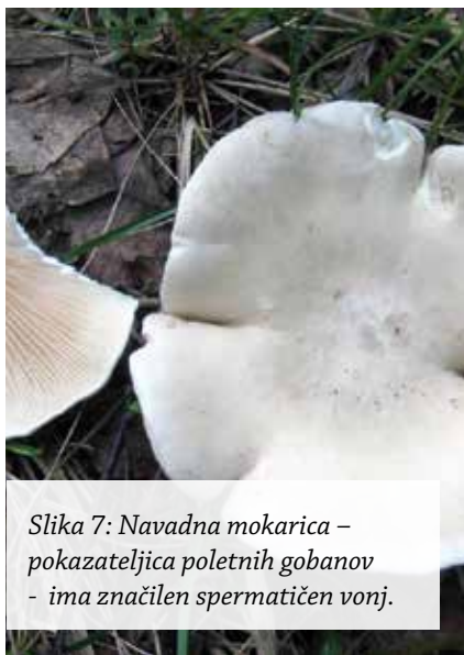
Slika 7: Navadna mokařica – pokazateljica poletnih gobanov - ima značilen spermatičen vonj.

Nekaj vonjev je kar točno vezano na svet okoli nas. Gobe dišijo po plutastem zamašku, starem sodu, starih nogavicah, po lokomotivi, po stroju, po zažganih nohtih, po steninah, po urinu, po mišjem urinu in zelo veliko jih ima spermatičen vonj. Med slednje sodijo nekatere razcepljenke in goba pokazateljica poletnih gobanov – navadna mokařica. To je tista goba, ki jo je naš determinator – mentor dr. Boh nagajivo poimenoval »Še pomnite, tovarišice?«