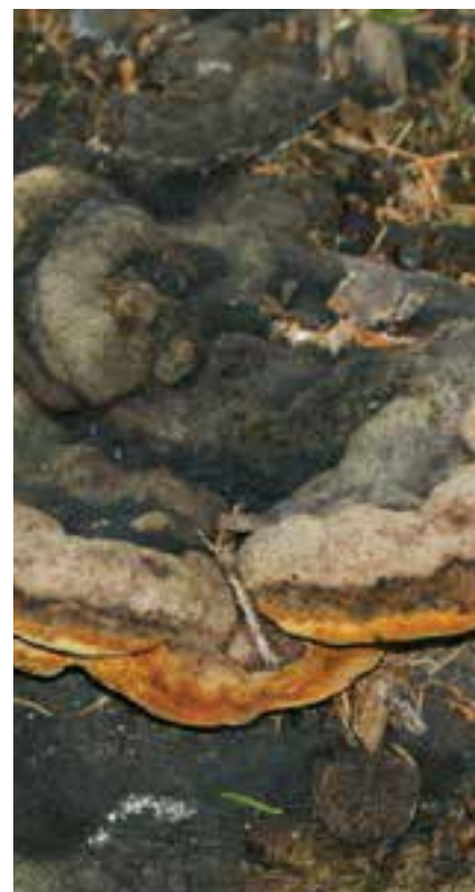
Slika 8: Dišeča tramovka je lesna goba, ki ima čudovit vonj neke med vaniljo, janežem in cikorijo.

Žal so nekateri vonji tudi težko opredeljivi, zato zanje srečamo opise, kot so: aromatičen, blag, prijetno dišeč, medel, moteč, neizrazit, kiselkast, sladek,... Zanimivo, da opisujejo vonj smrtno strupene koničaste mušnice kot »bolestno sladek«. In, da izjeme potrjujejo pravilo, je nekaj gob seveda nevtralnega ali brez vonja.