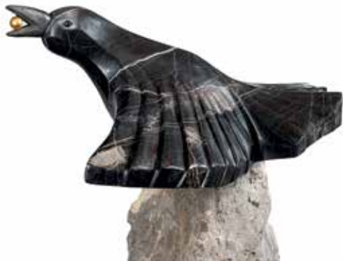
Krokar / Slavko Bračič