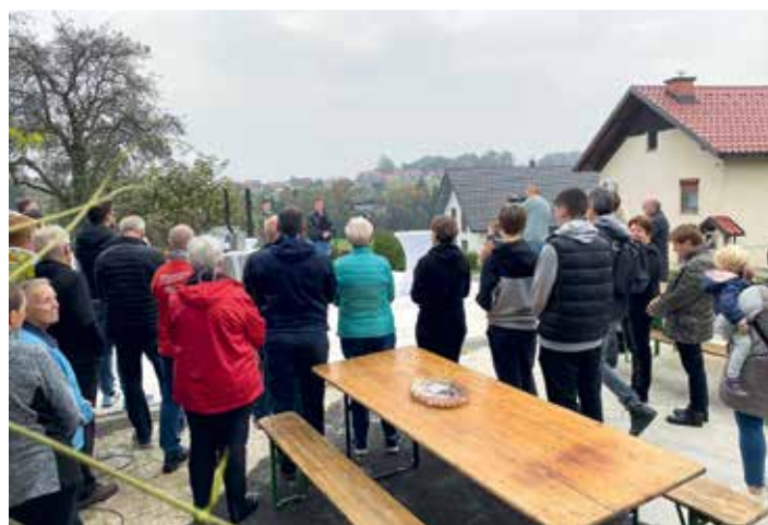
Krajani ob otvoritvi.