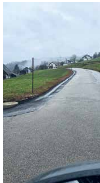
Odvodnjavanja v Gorenjih in Dolenjih Kamencah.