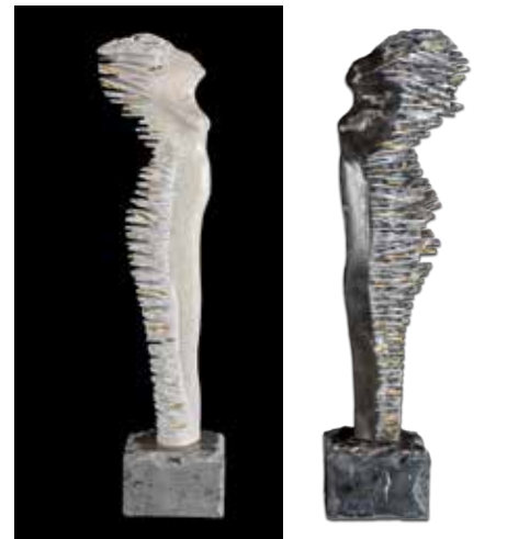
Bela in črna vila / Slavko Bračič