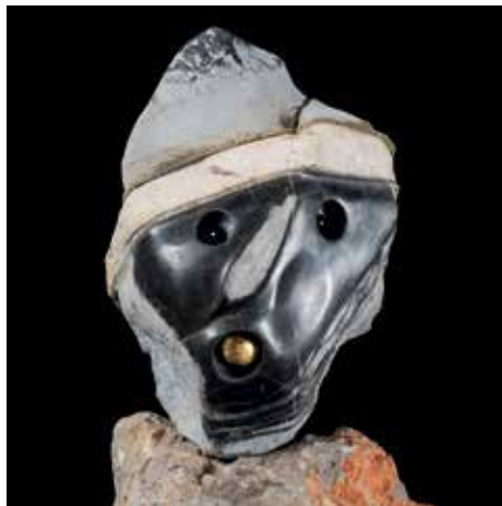
Škrat Škrip škrap / Slavko Bračič