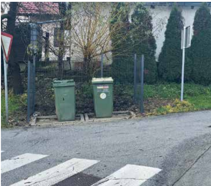
EKO otok na Muhaberju.