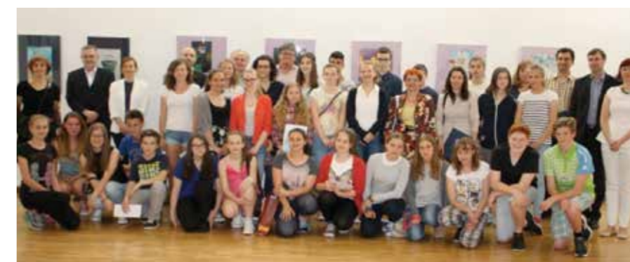
Udeleženci likovnega natečaja za osnovnošol- ce MESTNA VEDUTA 2015