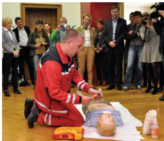
Kampanja kot del dejavnosti projekta, ki bodo tudi predstavljene v brošuri.

S projektom namestitve dodatnih avtomatskih eksternih defibrilatorjev (AED) v MO Novo mesto želimo opozoriti na relativno pogosto patologijo (nenaden zastoj srca pri skoraj 4000 ljudeh na leto, pri čemer jih skoraj 2000 na leto umre takoj) in v reševanje vključiti čim širši krog laikov oz. posredovalcev. Prednost avtomatskega eksternega defibrilatorja (AED), ki je vedno nameščen na javnem mestu in tako najbolj priročen ter hiter način pomoči, je, da je prvenstveno namenjen laikom.