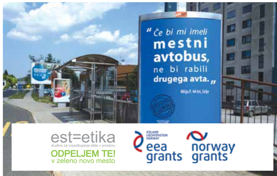
Kampanja kot del dejavnosti projekta, ki bodo tudi predstavljene v Brošuri.

Spremeniti miselnost in navade ljudi je težko, ne pa nemogoče. Zapletenosti izziva smo se lotili z nizom manjših dogodkov in