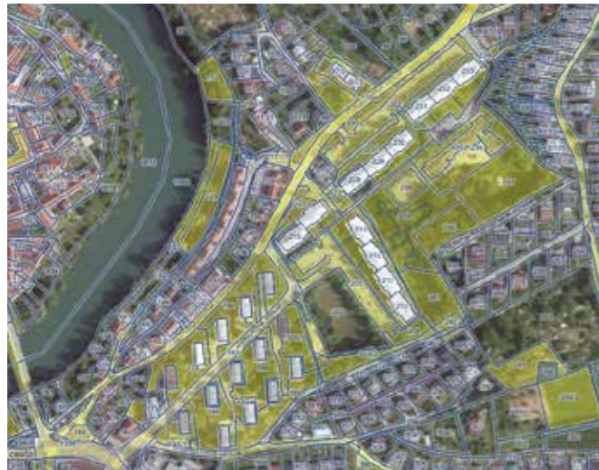
Karta 1. Zemljiške parcele v zemljiški knjigi, knjižene v last MO Novo mesto (Jakčeva, Ragovska).