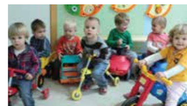
Otroci na poganjalčkih, kupljenih z donacijami in izkupičkom Ciciveselice.