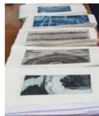
Unikatna grafična mapa 10 +