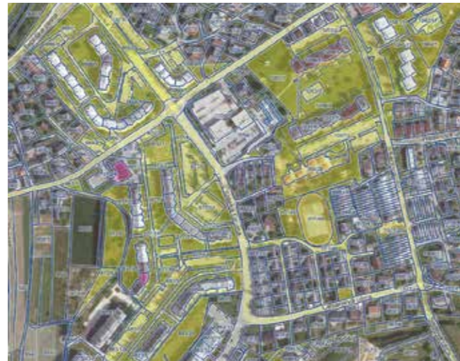
Karta 2. Zemljiške parcele v zemljiški knjigi, knjižene v last MO Novo mesto (Drska).

Širši javnosti, pogosto pa tudi etažnim lastnikom, je malo znana problematika tistih zemljišč, ki jih uporabniki večstanovanjskih stavb (blokovi) uporabljajo kot dvorišče, parkirišče, zelenico ali za drug podoben namen. Zemljišča, ki so funkcionalno povezana z blokom, tako da brez njih ni mogoče normalno uporabljati etažnih stanovanj, bi morala biti s stavbo neločljivo povezana, tako da bi bila v lasti etažnih lastnikov stanovanj . Večina takšnih zemljišč pa je v zemljiški knjigi še vedno vpisana kot last občin, ministrstev ali drugih pravnih oseb. Problem je žgoč v vseh blokih, zgrajenih pred letom 1991, za katere je stanovanjski zakon iz leta 1991 omogočil privatizacijo tistih stanovanj, ki so bila do takrat v družbeni lasti. Na osnovi tega zakona so lahko najemniki ta stanovanja odkupili skupaj s pripadajočimi zemljišči. Težave, ki se v povezavi s tem pojavljajo, pa so predvsem povezane z nezmožnostjo zagotavljanja dodatnih parkirnih prostorov, urejanja površin ob večstanovanjskih zgradbah ipd.