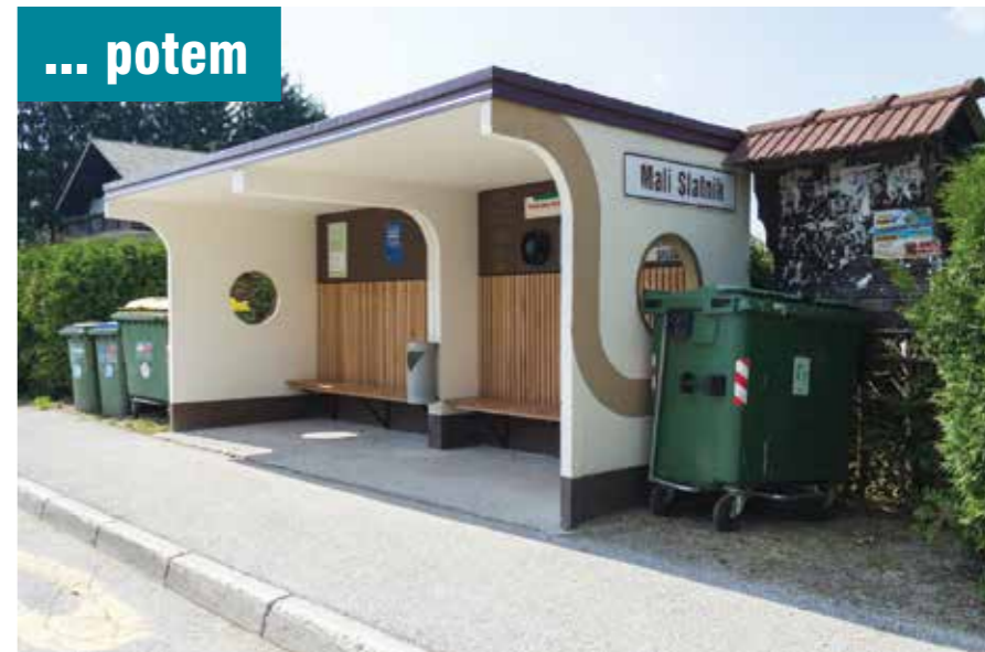
Postajališče Mali Slatnik pred obnovo in po njej. Domača zamisel – domači izvajalci – evropski denar.