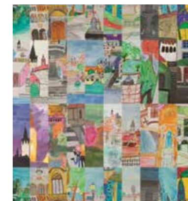
Naslovnica kataloga MESTNA VEDUTA

dejavnosti. V jubilejnemu letu smo izvedli dva večja projekta z naslovom MESTNA VEDUTA – skozi likovno govorico izrisana podoba mesta , likovni natečaj za vse no- vomeške osnovnošolce, ter izdelavo uni- katne grafične mape. Na likovnem nate- čaju je sodelovalo 59 osnovnošolcev. Ob tem je izšel priložnostni katalog, mladi likovniki pa so prejeli posebno priznanje Lamutova likovna paleta . Unikatno grafič- no mapo z naslovom 10 + pa so ljubiteljski grafični ustvarjalci razgrnili v Krajčevi hiši in se s tem poklonili velikemu moj- stru črne umetnosti.