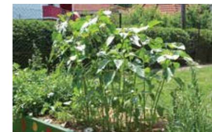
Ekogreda (šolski arhiv)