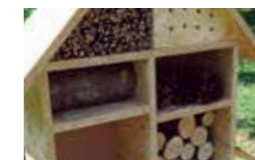
Hotel za žuželke

Osnovna šola Brusnice, na kateri imamo letos 168 učencev, je šola znanja, kulture, ekologije, športa in še česa.