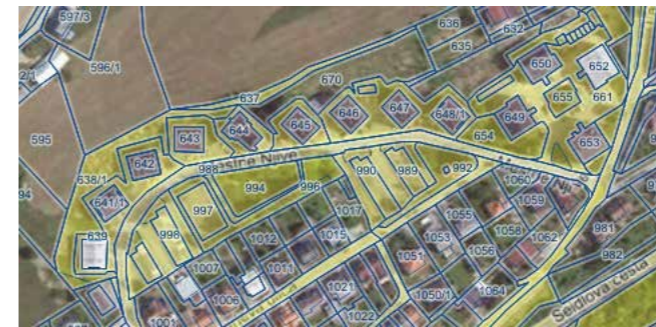
Karta 3. Zemljiške parcele v zemljiški knjigi, knjižene v last MO Novo mesto (Mestne njive).

Občina bo pri postopkih sodelovala v največji možni meri, ko jo bodo za to zaprosili. Za spodbujanje etažnih lastnikov, spremljanje postopkov in oblikovanje rešitev v problematičnih primerih je bil ustanovljen Svet za določanje funkcionalnih zemljišč. Na svet se lahko obrne kdor koli, vendar je zaradi velikega števila primerov učinkovitejše sporazumevanje prek upravnikov stavb.