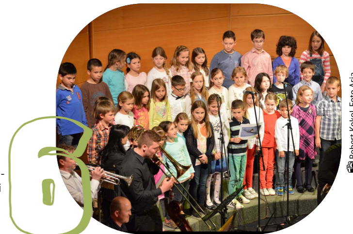
Robert Kokol, Foto Asja

Glasbene urice, namenjene predšolskim otrokom, temeljijo na spoznavanju glasbene dejavnosti, glasbenega ustvarjalnega izražanja, petja in igranja na enostavna glasbila. Otroci na uricah razvijajo posluš za ritem, melodijo, glasbeno pomnjenje, glasbeno domišljijo in muzikalnost, razvijajo glasbeni okus ter spoznavajo glasbene instrumente. Malčki lahko stopijo v svet glasbe v Glasbeni šoli Marjana Kozine, Muzikademiji ali Glasbeni šoli Lipičnik, kjer se jim glasba približa na igriv in dinamičen način preko igre, delavnic in druženja z vrstniki.