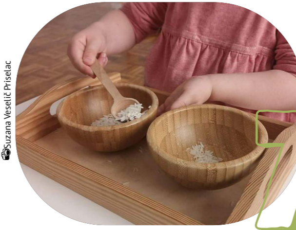
Suzana Veselič Priselac

V Zavodu Ajda pomagajo otrokom in vam reševati izzive v zvezi s kognitivnim razvojem, pri govorno-jezikovnih motnjah, motnjah pozornosti in motnji pozornosti s hiperaktivnostjo, pri izzivih na področju kratkoročnega in dolgoročnega spomina, na področju grobe/fine motorike, učnih ter čustveno-vedenjskih izzivih in izzivih koncentracije. Prav tako pomagajo otrokom s primanjkljajem na področju družbenih veščin (spekter avtizma) ter otrokom, ki se soočajo z izzivi na posameznih področjih učenja, npr. diskalkulija, dispraksija. Konec junija vabijo otroke v starosti od 5 do 12 let na gozdne delavnice, ki bodo potekale v Portovalu. Otroci bodo ves dan preživeli v gozdu pod krošnjami dreves, raziskovali gozd, urili spretnosti prste, se naučili tehnik preživetja in uživali v zvokih narave.