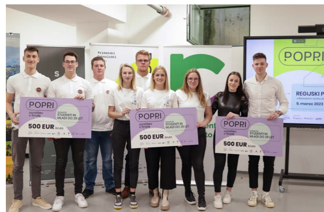
Zmagovalciv tekmovanju POPRI 2023 med študenti arhiv RC Novo mesto

V okviru SIO je svoje korenine pognal tudi Business Gladiator – vse bolj prepoznaven in priljubljen program, katerega bit je ne le izpostaviti najboljše start-up ideje v