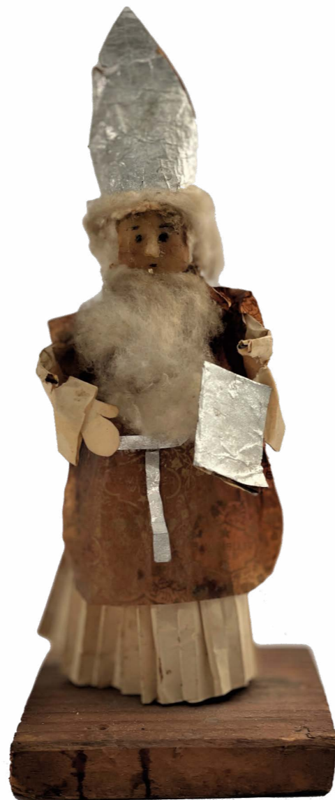
Figura Miklavža, izdelana pred drugo svetovno vojno