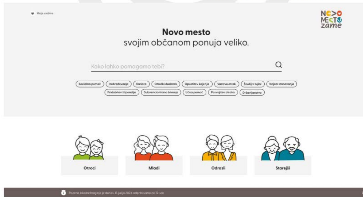
Prikaz vstopne strani spletnega kataloga

Za lažje dostopanje bo povezava do spletnega kataloga občanom na voljo tudi na spletni strani www.novomesto.si .