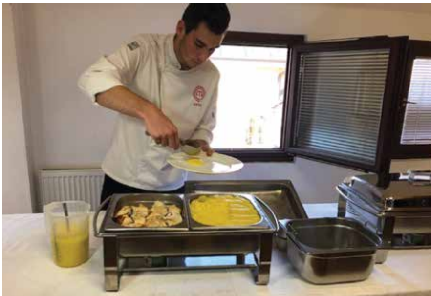
arhiv LAS DBK

Okus otrok se oblikuje v najbolj ranih letih. Ali bodo naši otroci znali ceniti dobro, zdravo hrano in ne nazadnje ali bodo »gurmani«, k temu veliko prispevamo tudi starši. S projektom »Z roko v roki do kakovostne prehrane«, v okviru katerega sta bili izvedeni anketa in analiza, smo želeli ugotoviti, v kolikšni meri javni zavodi koristijo možnost nakupa pridelkov direktno s kmetij (pridržana javna naročila). Kar 40 % anketiranih je odgovorilo, da te možnosti ne uporabljajo. To je precej visok odstotek v primerjavi z znatnimi sredstvi, ki jih država namenja za promocijo lokalno pridelane hrane. Še vedno večina zavodov (64 %) kupuje živila prek večjih trgovskih verig, le 17 % pri lokalnih kmetih. Vzrok za tako nizek odstotek je v sezonski pridelavi, nezadostnih kapacitetah skladišč, v pomanjkanju predpakiranosti... Zanimalo nas je tudi, koliko hrane se po javnih zavodih zavrže, torej je naši otroci ne pojedjo. Prav gotovo ni presenetljivo, da je na prvem mestu zelenjava, ki se je zavrže kar 20 %, na drugem mestu je sadje 17 %, sledi kruh. Na kulinarični delavnici v Hiši kulinarike Novo mesto – kuhanje obrokov iz tradicionalnih živil, na katero smo povabili organizatorje šolske prehrane, je pod budnim očesom MasterChefa Anžeta,