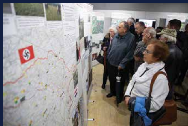
Praznovanje spominskega dne ustanovitve Novomeške čete smo obeležili z odprtjem razstave En krompir, tri države, Okupacijske meje na Dolenjskem 1941–1945 v Dolenjskem muzeju in s tradicionalnim nočnim pohodom ter slovesnostjo v Domu na Frati.