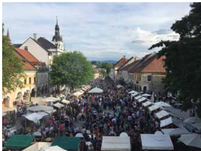
Odprta kuhna na Glavnem trgu