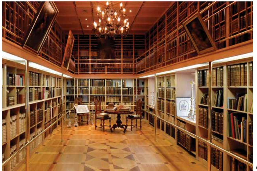
Župnija Nm - Klošter - Sv. Lenart

Letošnjo 550-letnico so že obeležili s ciklom zgodovinskih in drugih predavanj, novembra pa so nadaljevali s strokovnim simpozijem o prvih desetletjih frančiškanov v Novem mestu in njihovem pomenu za zgodovino mesta. Ob več letošnjih prireditvah in po slovesni akademiji, ki jo je pripravil Odbor za promocijo kulturne dediščine Novega mesta, bodo v samostanskih prostorih ob koncu leta odprli še stalno razstavo o življenju in delu frančiškanov.