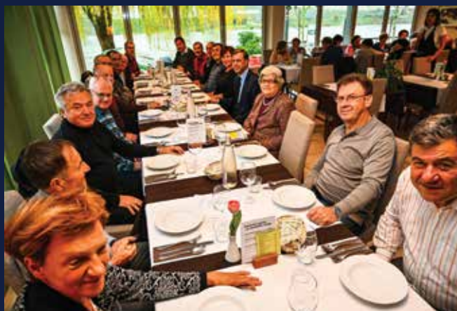
Župan se je na kosilu za požrtvovalnost zahvalil voznikom prostovoljcem, ki sodelujejo v priljubljenem sistemu za prevoze starejših in invalidov Rudi. Na mesec prepeljejo okoli 100 uporabnikov.