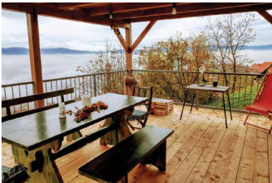
Čudovit razgled vse od trškogorske cerkve, do Trdinovega vrha, Gač in straških hribov.