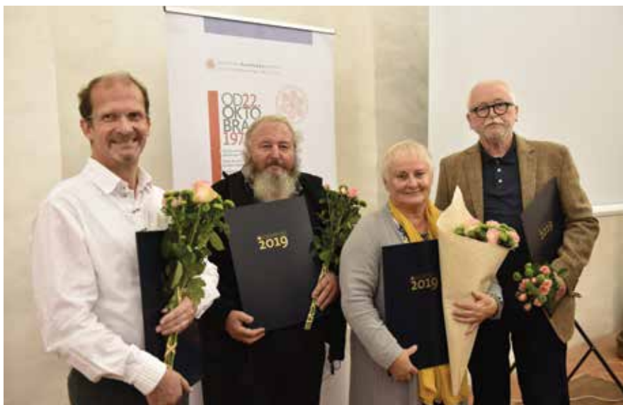
arhiv Dolenjskega muzeja

V vseh letih svojega službovanja je namenjala veliko pozornost kataložski objavi predmetov, s katero je dolgoročno poskrbela za dostopnost gradiva tako raziskovalcem kot širši javnosti. Sproti je s svojim delom seznanjala javnost s številnimi članki v Dolenjskem listu in v strokovnih revijah. Plod raziskovalnega in terenskega dela so