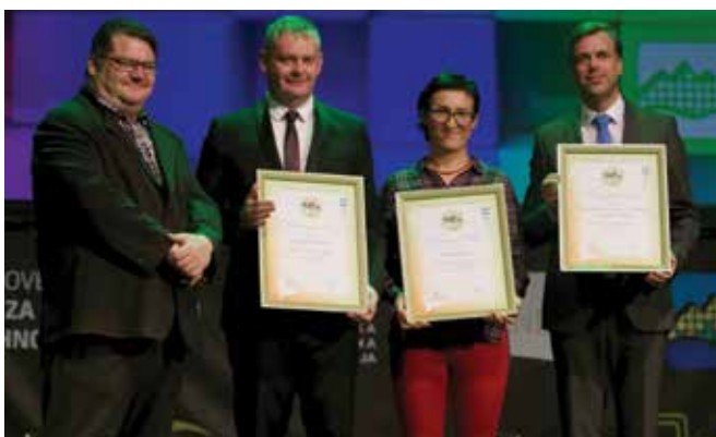
1. nagrada TZS v kategoriji mestna jedra

Glavni trg z okolico je tako danes predvsem prostor za občane, obiskovalce in priložnost za prireditve, ki intenzivno gradijo podobo prijaznega mesta. Sklop urbanih prireditev in vse bolj popularne rekreativne aktivnosti ob Krki danes predstavljajo enega izmed osrednjih turističnih potencialov mesta. Na septembrski Odprti kuhni smo ponovno zabeležili rekordni obisk in tudi dogodki drugih organizatorjev, kot so Petkanje, Kuhanu na kolesih, urbani festival, Novomeški poletni večeri, Teden kultur itd. ustvarjajo nove oblike preživljanja prostega časa. Novomeški 1/2-maraton je pritegnil rekordno število tekačev, Dolenjsko martinovanje postaja regijski dogodek in tudi prihajajoči Veseli december vsako leto beleži večji obisk.