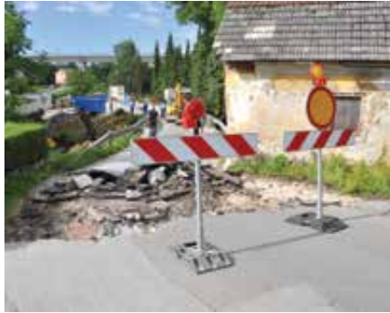
Kmalu bo preozek cestni odsek samo še spomin.