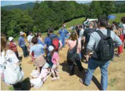
Prvi Praznik situl je na Kapiteljske njive pripeljal številne radovedneže.