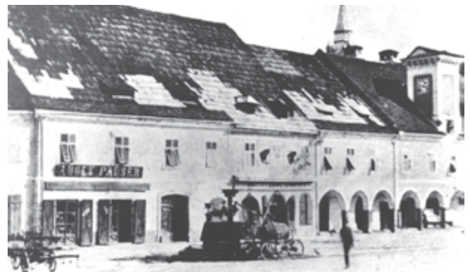
Mestni vodnjak v letu 1885 (Dolenjske novice so leta 1886 zapisale, da je Krka tako močno onesnažena, da bi jo morali za pitje prepovedati).

Stopiče ter izreka, da bo dežela to podjetje podpirala s 30%, vse pa s pogojem, da prispeva država v smislu zakona z dne 30. junija 1884, št. 116. drž. zak. 40% vseh stroškov.« Načrt je predvideval zajetje studenca Obrh v Stopičah, od koder bi potem črpali vodo v rezervoar na Božjem grobu, današnjem Grmu, in zbiralnik na Vertju, današnjem Marofu. Na vodnem viru je bila načrtovana batna črpalka z zmogljivostjo 49 m 3 vode na uro.