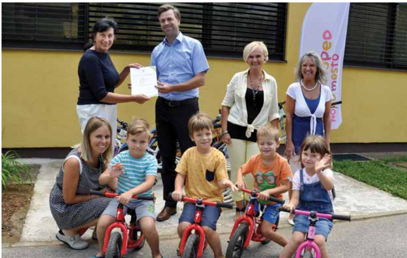
Vrtec Pedenjepad postal kolesarjem prijazen.

dejavnosti na temo mobilnosti: svoje delo v prometu so predstavili policisti, gasilci in reševalci, posledice neprimerne ravnanja v prometu so lahko preizkusili na demonstracijskih napravah zaletavček in alkoset, otroci so se na poligonih učili varnega kolesarjenja in pomena različnih oblik gibanja, nevladne organizacije so predstavile svoje delo na področju trajnostne mobilnosti, osrednji novomeški trg pa je, očiščen avtomobilov, postal tudi velikansko igrišče. Glavni trg je bil za promet zaprt od 6. do 16. ure, v času zapore pa je bilo mogoče brezplačno parkiranje na parkirišču v Kandiji.