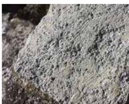
Fotografiji prikazujeta koncentrat (levo) in izrabljen zeolit obdelan po tehnologiji BACOM (desno).