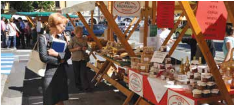
Živahne stojnice Novomeške tržnice so pritegnile tudi direktorico občinske uprave.