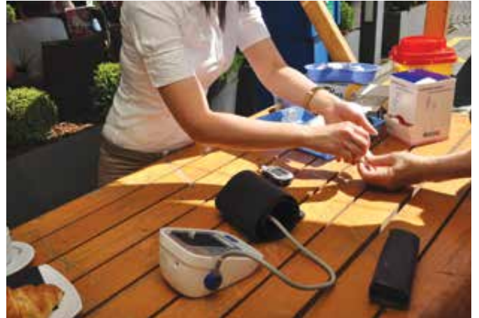
Osvežanje in preventiva za zdrav jutri.