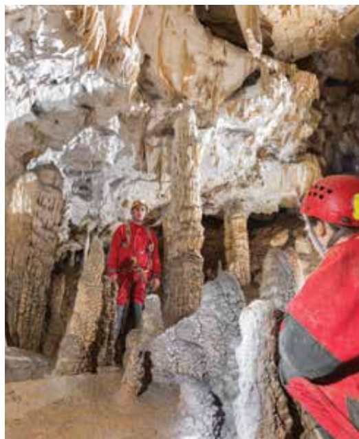
V jamah so poleg blata, vode in čudnih živali še nepopisno čudoviti izdelki narave, ustvarjeni v milijonih let. V Mestni občini Novo mesto je evidentiranih 162 jam različnih dolžin in globin, vse tja do 630 metrov dolžine in 70 metrov globine.