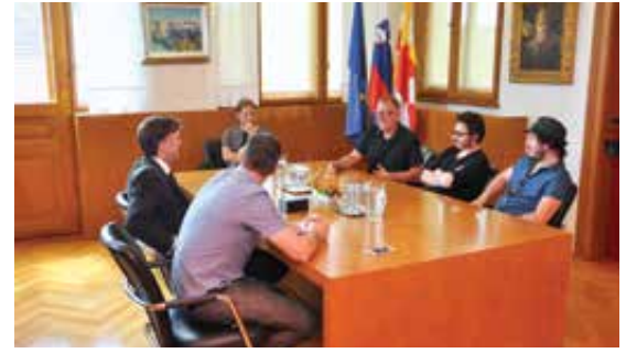
Rotovž v ritmu rokarskih rifov.