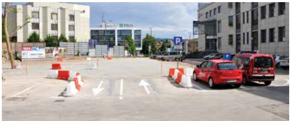
Dolga leta degradiran prostor na Novem trgu 6 je dobil uporabnejšo vlogo.