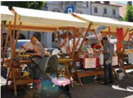
Petkovi dopoldnevi so kot nalašč za obisk Novomeške tržnice.