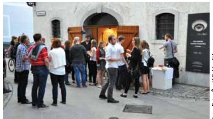
Ljubitelji umetnosti so v Galeriji Simutaker vedno dobrodošli.