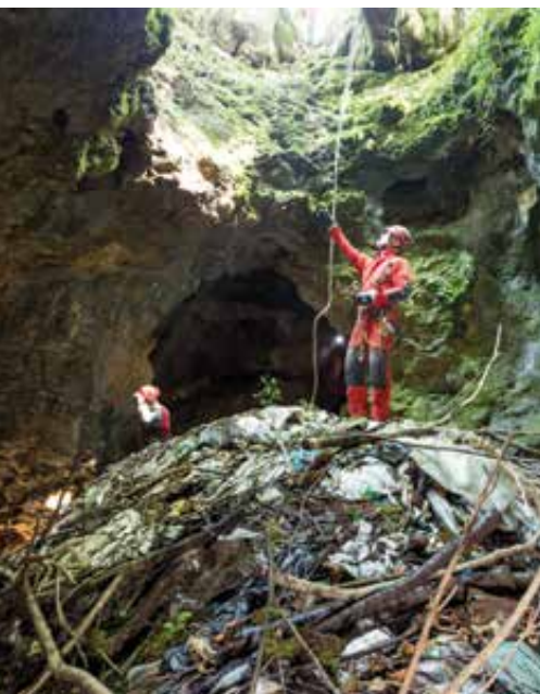
Največja težava pri čiščenju jam je iztvk odpadkov. Jamarji smeti običajno dvigajo s pomočjo sodov in vrvne tehnike, kar je zelo težko in zamudno delo.

Slovenija je tako rekoč prerešeta z jamami, odkritih in popisanih jih je 11 392, dobra četrtnina (3004) jih leži pri nas, na jugovzhodnem delu države. Čeprav se zdi, da povprečni občani z njimi nimamo veliko zveze, je to zgolj varljiv občutek. Ne tako davno tega s(m)o jame namreč uporabljali kot črna odlagališča za vse vrste odpadkov in tako se podtalnica, ki jo pijemo, še danes preceja skozi kupe nesnage. Ti počasi vendarle kopnijo, zahvaljujoč čistilnim akcijam jamarskih društev, med katerimi je posebej dejaven Jamarski klub Novo mesto.