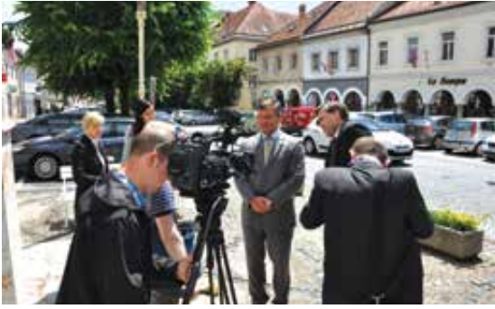
Glavna tema obiska ministra Gašperšiča je bila tretja razvojna os.