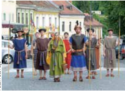
Glavni trg je s svojim spremstvom obiskal tudi halšatski knežji par.