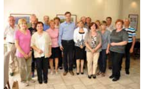
Tradicionalno druženje s krvodajalci.