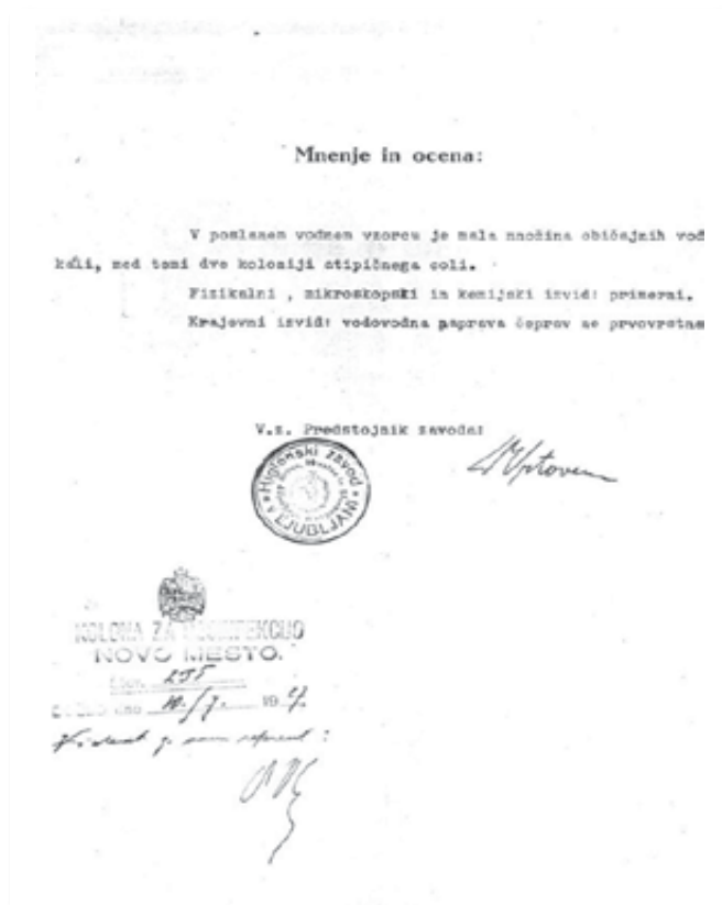
Mnenje in ocena kakovosti vode iz javnega vodovoda leta 1927.

Vodovod, zgrajen leta 1903, do leta 1941 ni doživel dosti sprememb. V tem letu pa je bil zgrajen vodovod od bolnice usmiljenih bratov do železniške postaje v Kandiji ter pozneje do železniškega prehoda v Irči vasi. Zgrajenega je bilo tudi nekaj omrežja po mestu, in sicer po današnji Gubčevi, Ragoški, delu Vrhovčeve ulice, Cesti herojev in Cankarjevi ulici. V letu 1940–41 je Higienški zavod v Ljubljani izdelal načrt čistilne naprave, ki naj bi bila zgrajena v podaljšku obstoječega črpališča v Stopičah, njena naloga pa naj bi bila čiščenje vode, ki se je ob dežju močno kalila. Ta investicija pa zaradi začetka II. svetovne vojne ni bila udejanjena.