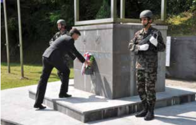
V Pogancih smo se poklonili tistim, ki so najbolj zaslužni za slovensko samostojnost.