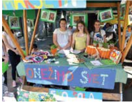
Tudi ekološki svet stoji na mladih.