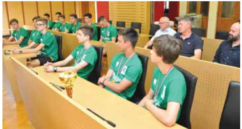
Uspehi mladih športnikov nas navdušujejo. Tudi odbojkarški.