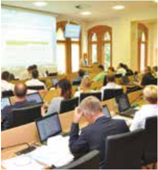
Zadnja seja občinskega sveta pred poletnim oddihom je bila julija.