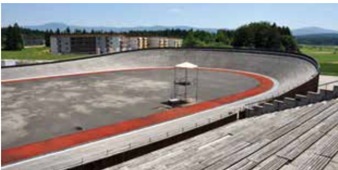
Velodrom si zasluži lepšo prihodnost.