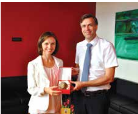
Situl za nasmejano britansko veleposlanico Sophie Honey.