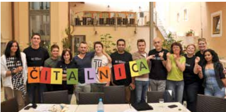
Živa knjižnica - ko knjige oživijo.