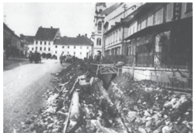
Gradnja vodovoda po Glavnem trgu (med letoma 1901 in 1903).

Aprila leta 1900 se je začela gradnja vodovoda Stopiče–Novo mesto. Vodovod je bil načrtovan za 3120 ljudi, na človeka pa se je takrat računalo 100 l vode na dan. V tem številu so bili zajeti poleg Novega mesta še prebivalci vasi Črmošnjice, Gotna vas, Jedinščica, Šmihel in Bršljin, z upoštevanjem 20-odstotne rezerve za prirast prebivalstva. Predračunska vrednost investicije je znašala takratnih 320 000 kron. Gradnjo so financirali državni melioracijski fond v višini 48 %, Kranjski deželni fond v višini 30 % in mestna občina Novo mesto z 22 %.