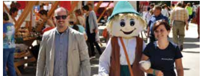
Dobro voljo smo po mestnem jedru sejali tudi s Kekcem.