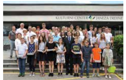
Novomeška prihodnost je svetla.