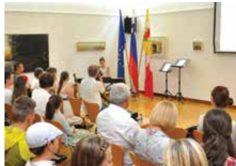
Ob koncu šolskega leta je seveda tudi čas za priznanja najboljšim šolarjem.