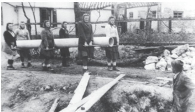
Gradnja vodovoda Stopiče Novo mesto leta 1953 (AC-cevi DN 250, ki so v uporabi še danes).

S to obnovo se je povečala zmogljivost vodovoda na 40 l/s in tako je bilo odpravljena stalna problematika pomanjkanja vode, s katero se je Novo mesto ukvarjalo vse od konca vojne. Gradbeno dela je vodil Režijski odbor za gradnjo vodovoda Novo mesto, ki je bil ustanovljen pri MO Novo mesto.