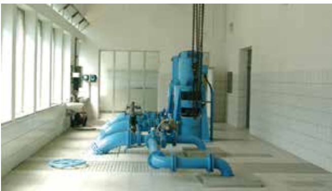
Črpalke na vodnem viru Jezero (Litostroj 160kW, 110l/s).

Konec šestdesetih let se je v Novem mestu zaradi močne industrializacije in urbanizacije vnovič pojavilo pomanjkanje vode. Treba je bilo zajeti nov dovolj močan vodni vir, ki bi pokrival tudi dolgoročne potrebe po pitni vodi za Novo mesto in širšo okolico. Tako so bili v letu 1970 izdelani načrti za izgradnjo črpališča na izviru Jezero v Družinski vasi, magistralnega cevovoda Družinska vas–Novo mesto ter novega rezervoarja prostornine 700 m 3 na Kiju. Gradnja se je začela v letu 1973 in končala v letu 1975. Slovesno odprtje novega vodovoda je bilo 29. oktobra 1975. S to investicijo je vodovod pridobil dodatnih 220 l/s vode in s tem možnost za širitev vodooskrbe v Šentjernej, Belo Cerkev, prek Bučne vasi, Kamenc in Daljnega vrha pa je bil vodovod napeljan tudi v Mirno Peč in prek Prečne v Stražo.