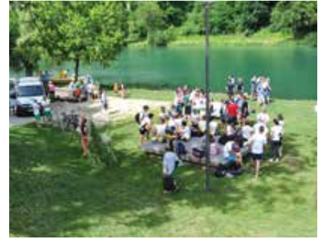
Občinske barve so bile tudi na veslaški preizkušnji delavskih športnih iger.