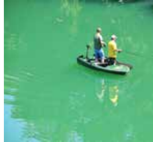
A danes kaj prijemljejo?