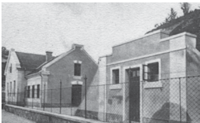
Črpališče Stopiče, 1903.

MO Novo mesto je bil po dogovoru, sklenjenem med državnim melioracijskim fondom in Kranjskim deželnim fondom, dolžan pokriti tudi prekoračitve. Ta je znašala okoli 13 000 kron, tako je celotna investicija stala 333 000 kron. Vodovod je bil dograjen avgusta 1903 in je brez posebnih sprememb obratoval do leta 1914. Takrat pa obstoječa črpalka ni mogla več zagotavljati potrebnih količin vode, saj se je črpalni čas povečal celo na 23 ur na dan. Tudi zaradi podražitve bencina med 1. svetovno vojno so za pogon vgradili staro lokomotivo, ki je obratovala vse do leta 1921. Takrat so v Stopiče napeljali elektriko in pogon črpalke preuredili na električni pogon z elektromotorjem 10 KS. Leta 1929–30 je bila takratna batna črpalka zamenjana s centrifugalno črpalko zmogljivosti 20 l/s in z elektromotorjem moči 30 kW. V letu 1936–37 je bil zaradi pogostih izpadov električne energije vgrajen dizelski agregat na lesno oglje, ki je obratoval vse do 2. decembra 1943.