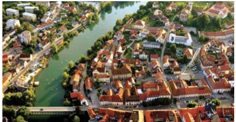
Radi imamo svoje mesto.