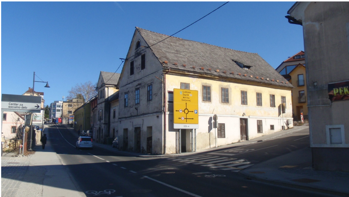
Slika 3: pogled na predmet obravnave iz zahoda

Verjetno sredi 19. stoletja je na mestu treh objektov nastal en vzdolžni objekt ob sedanji Resslerji ulici. Ali so takratne tri objekte porušili in novega zgradili od tal, ali pa je šlo za novogradnjo, v katero so vključili vsaj del takratnih objektov kljub raziskavam ni mogoče ugotoviti. Iz primerjave katastrofov in debelin zidov bi morda lahko sklepali, da je prvotna hiša skrita v južnem delu sedanjega objekta. K temu pritrjuje tudi zalom na zahodni fasadi, s katerim bi se izognili preglobokemu poseganju v križišče, če bi se držali smeri ohranjenega objekta. Oblika vzdolžnega objekta ni jasna, saj jo po sedanjem zidovju ne moremo rekonstruirati. Skica izmere iz leta 1893 kaže na prizidavo pravokotnega trakta k dotedanjemu vzdolžnemu objektu ob Resslerji ulici. Ker ima celoten stavni kompleks enotno fasado, je današnja podoba hiše verjetno iz tistega časa. Večjih sprememb kasneje ni bilo, razen okoli leta 1990, ko je občina ob obnovi Kandijske ceste v kletni etaži naredila podhod za pešce.