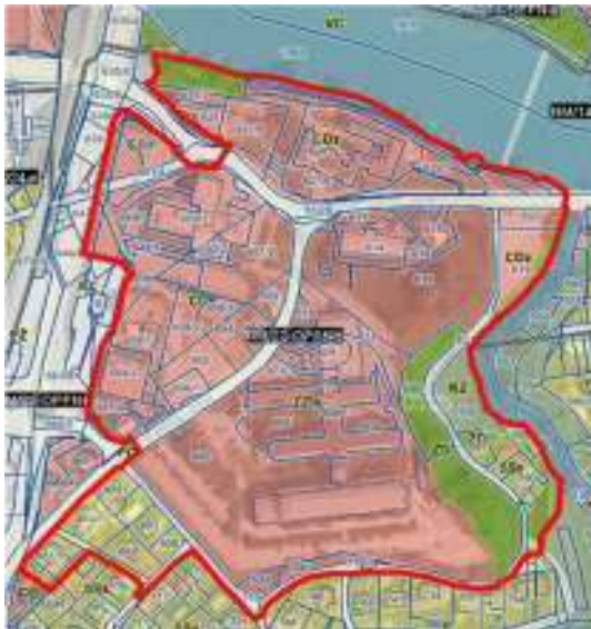
Slika 1: Prikaz območja UN iz OPN

Mestna občina Novo mesto vodi postopek priprave sprememb in dopolnitev Ureditvenega načrta Zdravstveni kompleks Novo mesto (v nadaljevanju: SD UN ZKNM-4). SD UN ZKNM-4 se pripravljajo na podlagi Zakona o urejanju prostora - ZUreP-2 (Uradni list RS, št. 61/17). Pobudnik priprave SD UN ZKNM-4 je Splošna bolnišnica Novo mesto, Šmihelska cesta 1, 8000 Novo mesto, izdelovalec prostorskega akta pa podjetje TOPOS d.o.o.