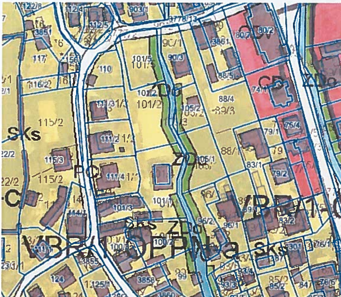
Slika 1. Izrez iz veljavnega OOPN.

Za ta območja OOPN določa podrobnejši PIP za površine podeželskega naselja (SKs), ( 8) poglavje 110. člena OOPN. ( Izrez iz OOPN, slika 2) katerih predlog ( SD OLN2) na delu PE B ne izpolnjuje v večini točk. ( glej veljaven PIP)