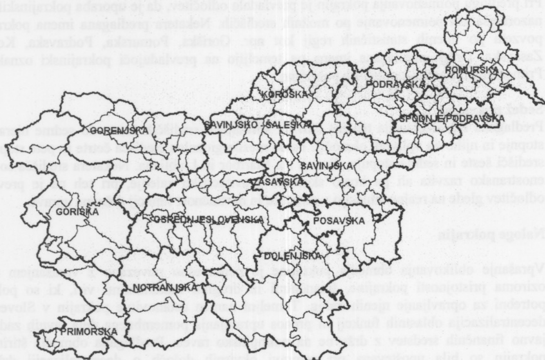
Karta: Predlog regionalizacije Slovenije na 14 pokrajin

Predlagani sistemski zakoni, v skladu z ustavo in Evropsko listino lokalne samouprave zagotavljajo pokrajini pravni status pravne osebe javnega prava in premoženjsko ter finančno avtonomijo, neločljivo povezano s pristojnostmi pokrajine. To pomeni, da imajo pokrajine premoženje in vire financiranja, s katerimi na podlagi pokrajinskega proračuna samostojno upravljajo. Premoženje pokrajine je namenjeno izvajanju njenih pristojnosti, viri financiranja (davčni in nedavčni viri), kombinirani s sistemom finančnih izravnav iz državnega proračuna, pa zagotavljajo financiranje nalog. S predlogi zakonov je urejen prenos pravic na stvarnem premoženju države, namenjenem izvajanju decentraliziranih nalog in prenos ustanoviteljskih pravic v osebah javnega prava tako, da bodo to urejali zakoni, s katerimi bo prenos opravljen.