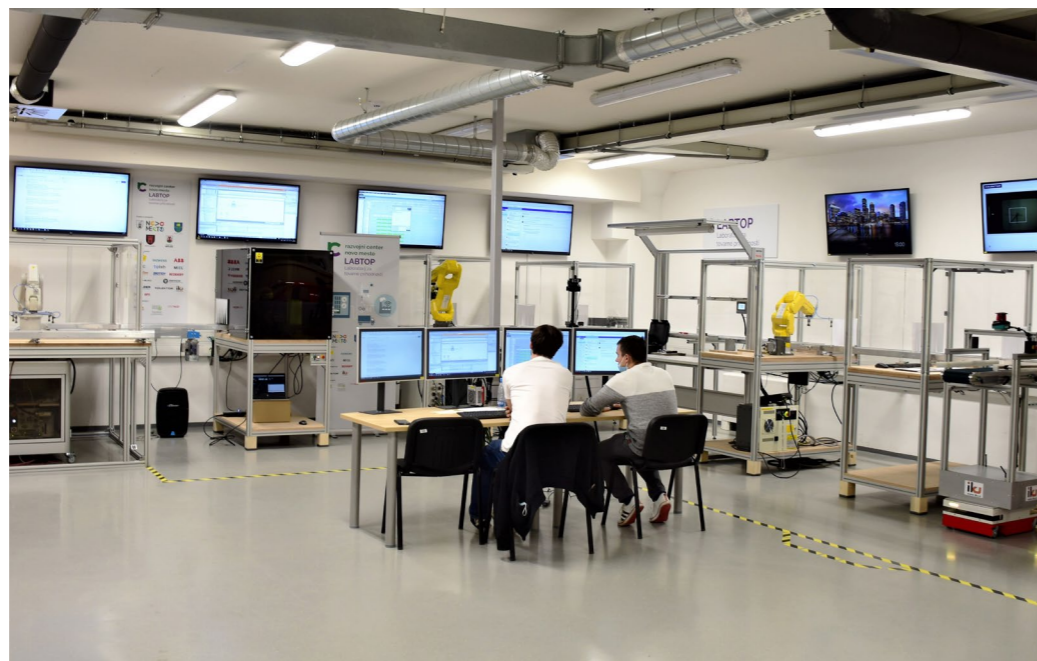
Sodoben laboratorij, postavljen kot tekoči trak v proizvodnji, je namenjen izobraževanju in prenašanju znanja v dejanske proizvodne sisteme.