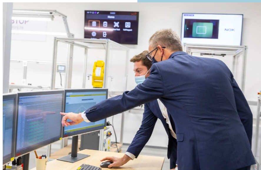
S pritiskom na miško sta direktor in minister uradno zagnala proizvodnjo.

V okviru dogodka »Digitalno razstavišče – Tehnologija za ljudi« se bodo v obdobju med 29. 11. in 24. 12. v ljubljanskem BTC-ju odvijali dogodki pod skupnim naslovom »Robotika in Industrija 4.0«. V okviru tega dogodka se bo Razvojni center Novo mesto predstavil v petek, 17. 12., s celodnevni predavanji na temo Pametna tovarna v praksi.