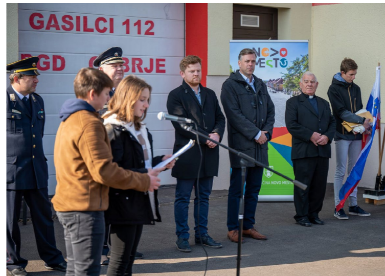
Jaka Ercegovčević