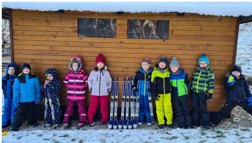
Prilagajanje na tekaško opremo