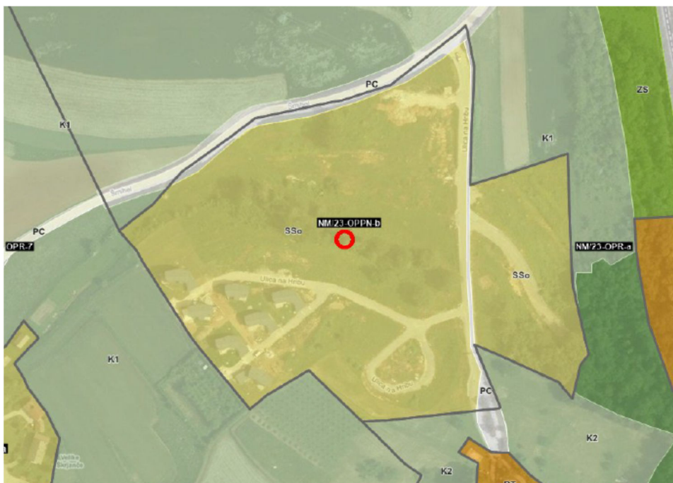
Slika 1: Izsek iz OPN: Območje OPPN oz. EUP NM/23-OPP-N-b

Mestna občina Novo mesto vodi postopek priprave občinskega podrobnega prostorskega načrta Mrvarjev hrib (v nadaljevanju: OPPN). Postopek se je začel s sprejetjem Sklepa o začetku priprave OPPN, ki je bil objavljen v Dolenjskem uradnem listu dne 7.4.2017 (št. 7/17), in sicer na pobudo Deželne banke Slovenije d.d.