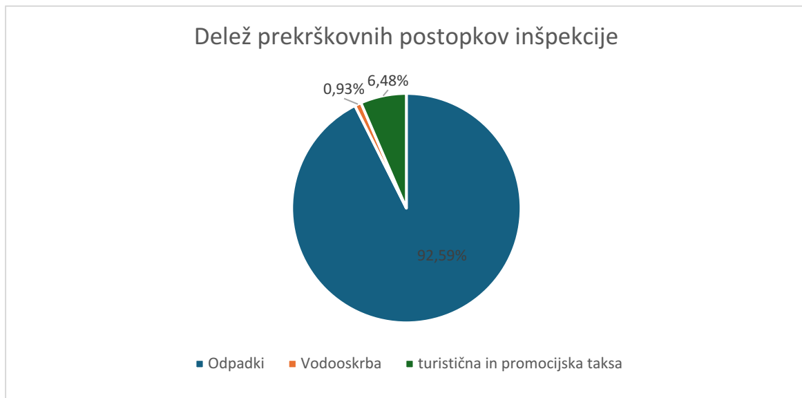
Slika 3: Delež prekrškovnih postopkov po delovnih področjih inšpekcije za Mestno občino Novo mesto

Prikaz deleža prekrškovnih postopkov po delovnih področjih inšpekcije: