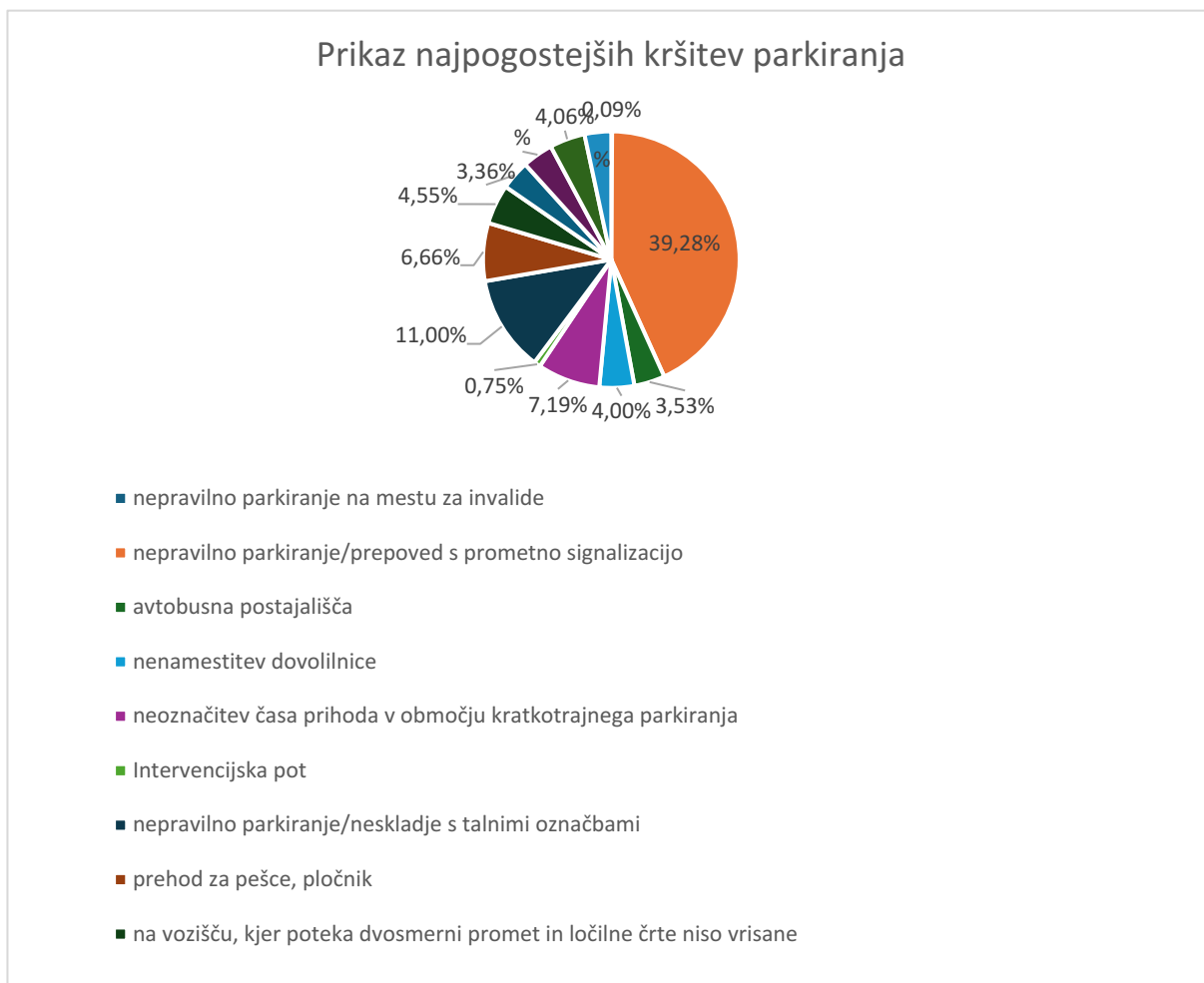
Slika 4: Delež najpogostejših kršitev mirujočega prometa v Mestni občini Novo mesto

Graf razmerja najpogostejših kršitev parkiranja: