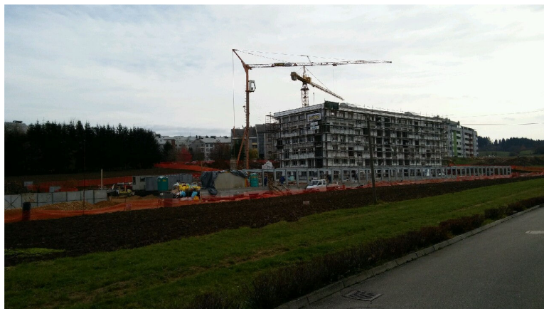
Slika 1: Stanje novogradnje 12. november 2017

V začetku leta 2018 se zaključuje gradnja prvega od več večstanovanjskih objektov v sklopu OPPN Mrzla dolina – zahod v soseski DRSKA - BROD. Objekt bo imel 2 vhoda s skupaj 52 stanovanji, v katerem bo živel med 150 in 200 prebivalcev. Po končani izvedbi celotnega OPPN bo imela ulica ca. 500 prebivalcev.