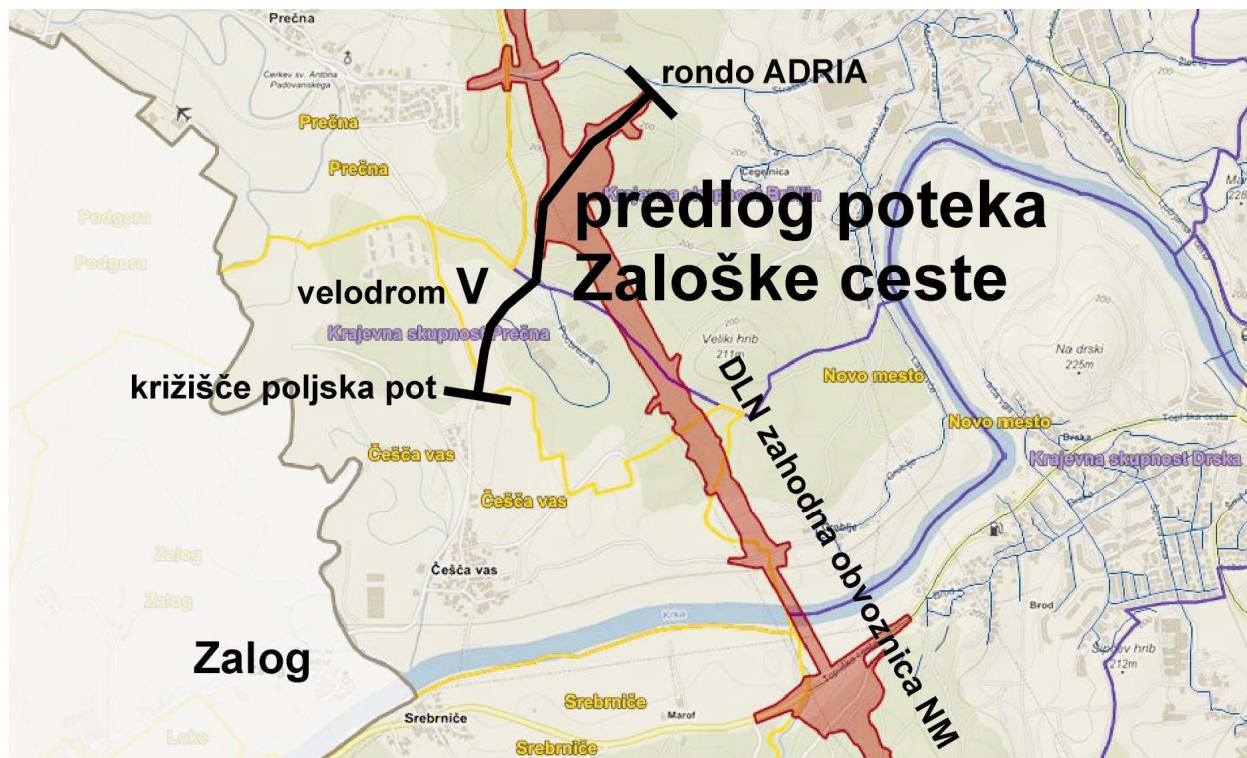
Grafika 1: Prikaz predloga poteka Zaloške ceste v Novem mestu

Zaloška cesta: predstavlja povezovalno cesto med Novim mestom in predmestnimi ulicami in naselji s stanovanjsko, poslovno in športno rekreacijsko dejavnostjo na zahodnem delu Novega mesta.