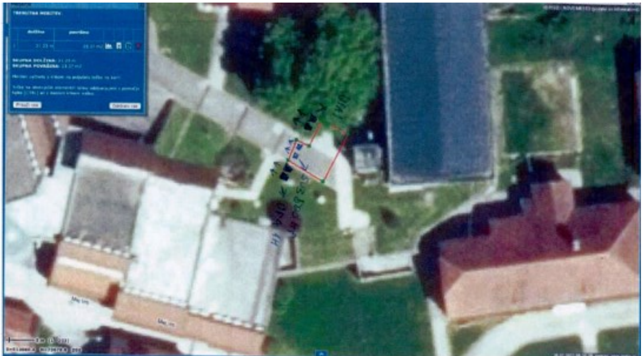
Slika 2: Shema nastavitve zvočne naprave

Priloga: Poročilo o emisiji hrupa v okolje