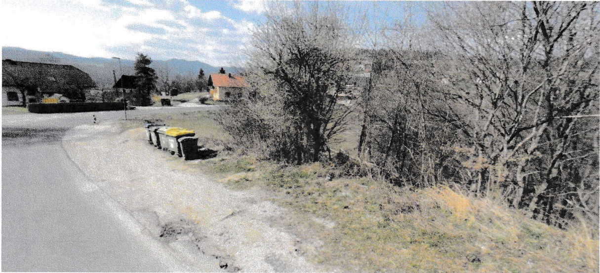
Slika 3: Fotografija stanja površine zemljišča v naravi (pogled v smer Novo mesto)