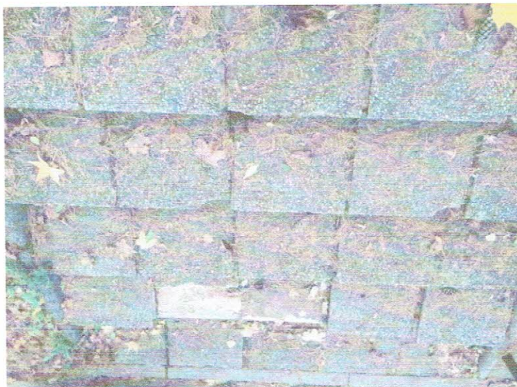
Stanje po adaptaciji: